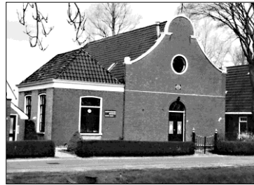
Start 2: Doopsgezinde kerk De Knipe Ds. Veenweg 61 8456 HK

De fietsroute begint aan de overkant van de Schoterlandseweg door de Zijweg in te fietsen. De Zijweg gaat over in een fietspad (het Bospad). Het fietspad geheel uit fietsen; deze gaat over in een verharde weg. Weg vervolgen tot T-splitsing waar u L.af gaat. Op kruising R.af (Hogeveensweg). Halverwege L.af bij fietsroutebord nr. 99 (het Imke Klaverpad). Fietspad geheel uit fietsen en bij T-splitsing R.af (Jan Jonkmanweg). Deze weg geheel uit fietsen tot u bij de Compagnonsvaart komt. Ga de brug over en sla L.af. Na 100 meter ziet u de Doopsgezinde kerk van De Knipe.