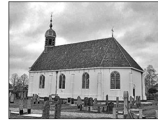
Start 3: Nije Brongergea Tsjerke De Knipe Meijerweg 70 8456 GH

Fiets langs de Ds. Veenweg richting Heerenveen. Deze weg gaat over in de Meijerweg. Halverwege deze weg ziet u aan de linkerkant het bord met “Kerkelijk centrum van de Nije Brongergea Tsjerke” erop. Schuin achter dit gebouw bevindt zich de kerk.