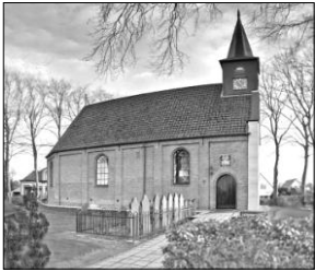
Start 1: Kerk van Nieuwehorne, Schoterlandseweg 38 8414 LX

Deze huidige kerk is in 1779 gereed gekomen maar reeds in 1315 heeft hier een kerk