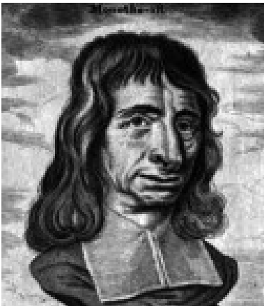
Balthasar Becker (1634-1698)