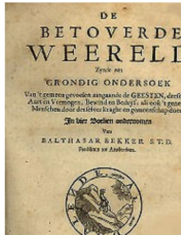
Titelblad De betoverde wereld

De Dorpskerk van Metslawier is gebouwd in 1776. Uit die tijd stamt ook de preekstoel en een herenbank. Er zijn een grafkelder en diverse oude zerken. Zelfs één met een tekst in het oud-Fries. De luidklok is uit 1711 en gegoten door Petrus Overney. Het orgel, afkomstig uit Spannum, is in