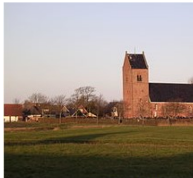
De Buorren 14