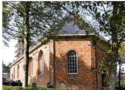
Hervormde of Sint-Gangulfuskerk van Ee