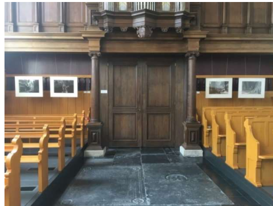
Foto's van Linus Harms in kerk van Dronrijp opgehangen onder orgelruimte