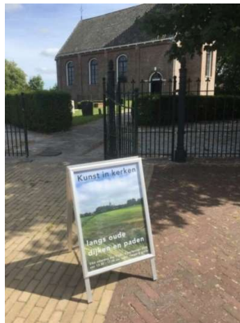
Voorbeeld vooraankondiging expositie kerk