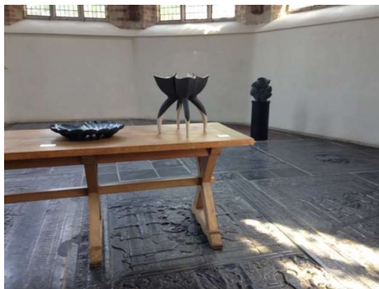
Keramische objecten van kunstenaar Riet Bakker in de kerk van Minnertsga gebruikmakend van bestaande nissen en avondmaaltafel.