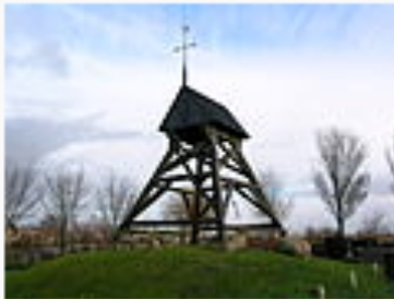
Het klokhuis van Idzegea

In het gebied tussen Oudega en Gaastmeer is het gebruik van de grond gebonden aan door de boeren met elkaar gemaakte afspraken.