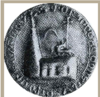
Zegel met kerk 1355