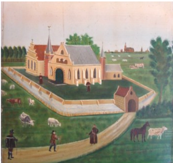
Een tekening van het 16e eeuwse